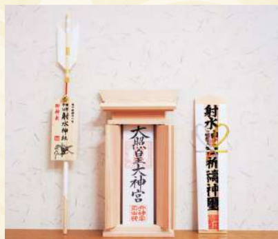
「神棚」に祈願のお下がりを お祀りする場合（一例）

「お神札」を紙袋よりお出しいただき、ご自宅や居室、会社・店舗・職場でお祀りされている「神棚」にて、「天照皇大神宮」（伊勢の神宮大麻）、「射水神社」（神符）と共に並べてお祀りください。 神棚の「宮型」をまだ設けてない際には、居室の窓際や書棚、タンス、サイドボード等、清浄で明るい適宜な場所に、並べて立て掛けてお祀りいただいても結構です。 災厄を祓う「御神矢」・開運招福「熊手」等の縁起物は神棚や玄関など、目立つところにお飾りします。