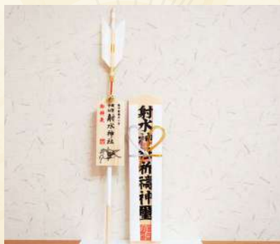
「神棚がない」場合の祈願お下がりの 祀り方（一例）