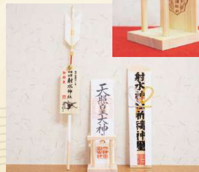
「神棚」をお持ちでない方へ 「お神札立て」（初穂料 500 円）