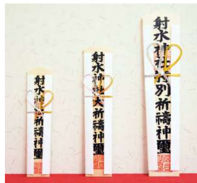
左から祈願・大祈願・特別祈願のお神札

答 お神札の大きさにより、「御神威」（神様のお力）が異なることはありません。 何よりも大切なことは、日々“おまつりをする心”です。 神様への感謝、祈りの気持ちでお納めする初穂料はそれぞれ異なりますので、皆様のご奉賛のお気持ちに添うべく、お神札の大きさを変えております。 神社からの距離が離れた家庭や会社からでも、毎日、神社を遙かに お参りするために「お神札」があります。また、常に身近にあって、 身心をお守りいただくためにあるのが「お守り」です。 お神札やお守りを通して、朝夕に神様へ感謝・祈りの気持ちをお伝え し、神様を身近にお参りすることで、お力とご守護をいただくことが 出来ます。